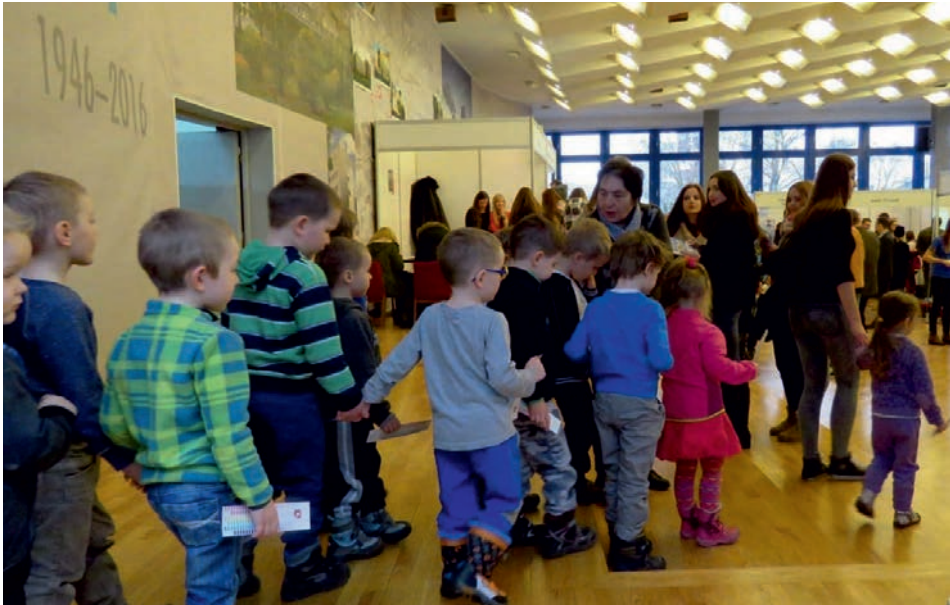
Fig. 1. The youngest participants of the Open Day at the Pedagogical University in Kraków